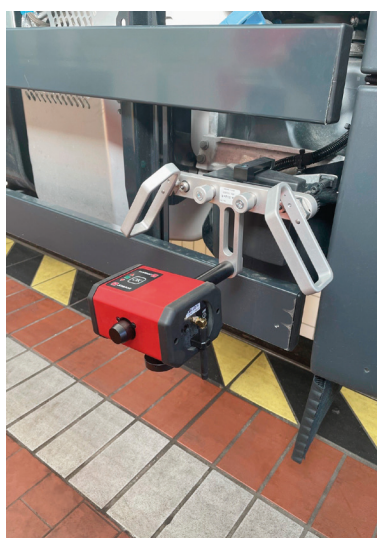
Étalonnage du radar latéral (adaptateur radar MAN nécessaire)