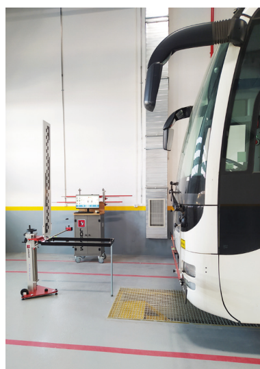
Étalonnage caméra sur bus

L'étalonnage des systèmes d'aide à la conduite est essentiel pour garantir la sécurité et les performances des véhicules. Notre système d'étalonnage statique du système d'aide à la conduite offre des avantages significatifs en matière de sécurité en garantissant un alignement précis et la fonctionnalité des capteurs de sécurité active sans nécessiter d'étalonnage sur route.