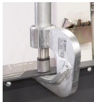
Art. no. JO 1289 K A/21573