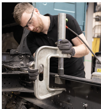
Art. no. SR 29 K A/21572