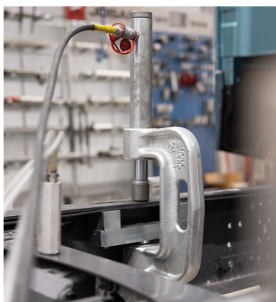
Art. no. SR 31 K A/21567