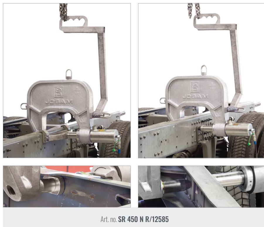
Art. no. SR 450 N R/12585