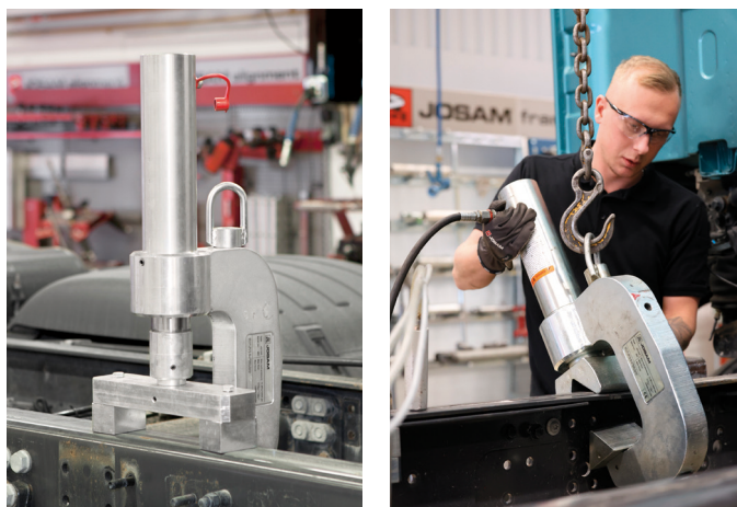
Art. no. JO 1320 K A/21571