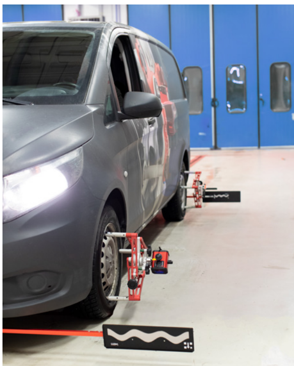
Furgoneta medida con rodillo múltiple