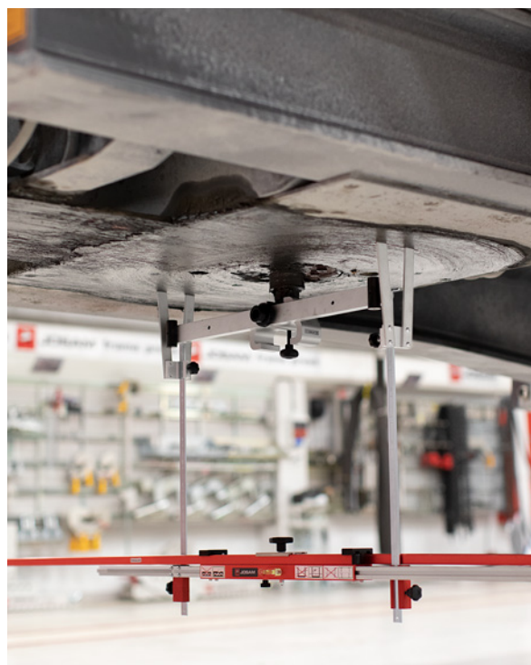
Medición de semirremolque