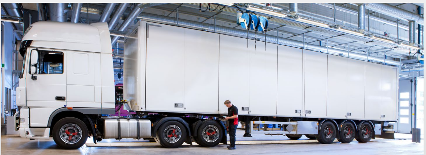
Misurazione di un autoarticolato completo (trattore + semi-rimorchio)