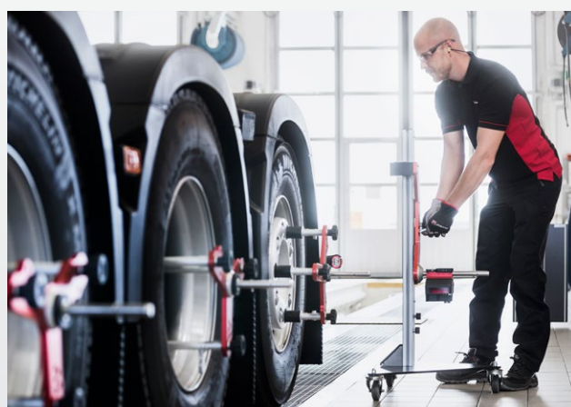
Strumento di misura senza contatto con chassis e carrozzeria

Il sistema i-track II è sinonimo di eccellenza in qualsiasi operazione di allineamento ruote.